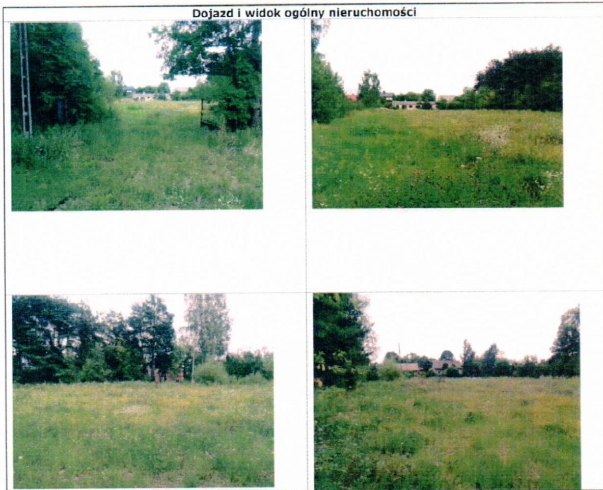
Dojazd i widok ogólny nieruchomości